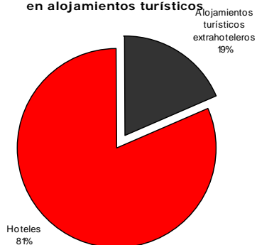
Distribución porcentual de las pernoctaciones en alojamientos turísticos