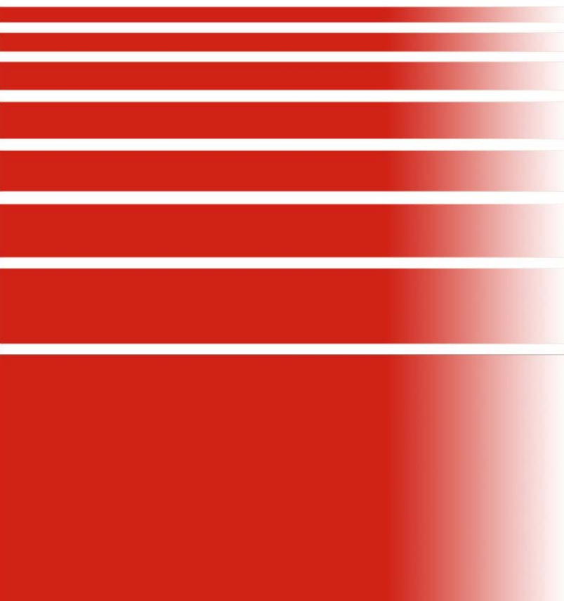
Tabla 4.27: Industria textil, 1861-1961 (Tms)

Tabla 4.26: Industria de la alimentación, bebidas y tabaco. 1888-1982